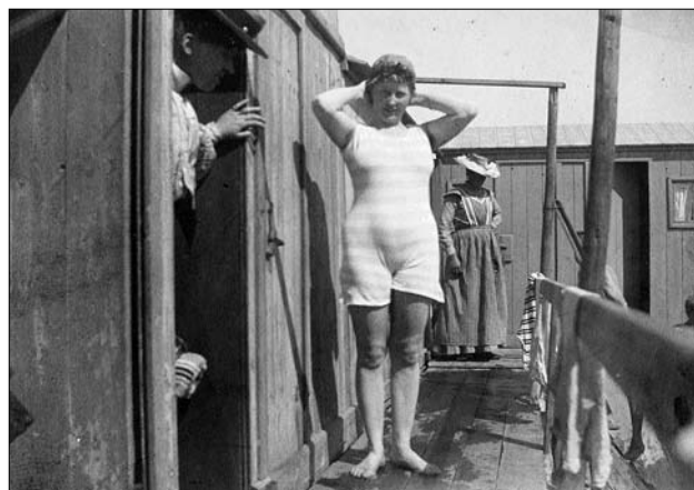
Omkledning på Søndre Badeanstalt

havbad lå nedenfor Varna. Desværre eksisterer ingen af dem mere. Trouville blev nedlagt i 1943 og Varnas Havbad i 1950. Forinden var Ballehage Havbad imidlertid opført i 1929. Det fungerer stadig og er senest udbygget i 1979. Det har ikke de samme æstetiske kvaliteter og trænger voldsomt til en opretning, men det er stadig rammen om to vinterbadeklubber og et stort antal badegæster i sommermånederne.