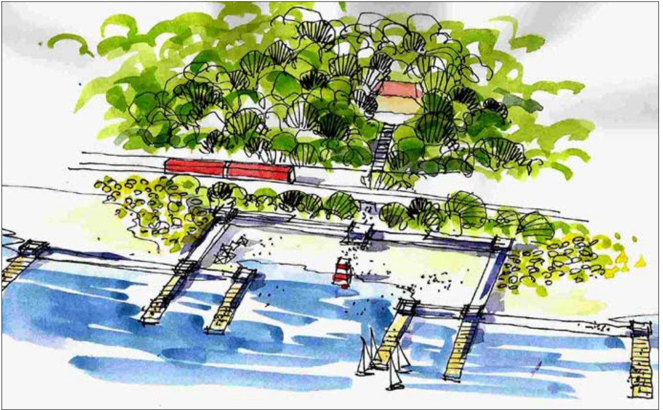
Sådan kunne Den Permanente se ud - anlagt som i 1933, men i en tilpasset moderne version