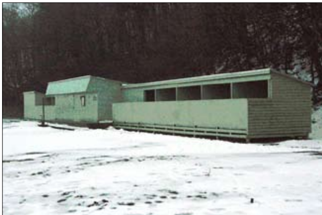
Havbadets bygninger set fra nord. Hovedindtrykket er en meget nedslidt bygning

I den rapport om Ballehage Havbad, som Ingeniørfirmaet Carl Bro i september 2003 udarbejdede for Århus kommune er der estimeret en række udgifter til vedligeholdelse og opretningsarbejde over en tiårs periode. Desværre er der i rapporten overhovedet ikke taget hensyn til de æstetiske forhold eller de ulemper som det nuværende anlæg har i den daglige brug. Der er i rapporten heller ikke givet bemærkninger om badeanlæggets udsatte beliggenhed ved stormfloder, og hvilke foranstaltninger dette burde medføre. Alene denne vinter har der været to sådanne episoder, hvor effekten af flere naturkræfter samles i et.