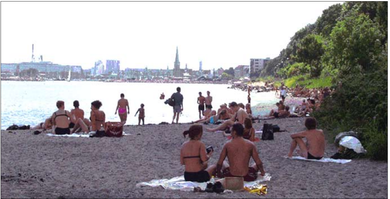
Vue fra stranden syd for Den Permanente mod byen. Nærheden til de kommende byudviklingsarealer på havnen er enestående og repræsenterer et væsentligt rekreativt potentiale. Der er under 1 km fra badeanstalten til bådhavnen og Langeliniebyggeriet.