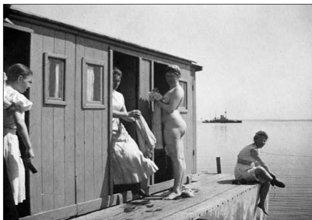
Badenymfer på Søndre Badeanstalt

Især havbadet Trouville udmærkede sig. Den lå nedenfor Ørnereden og var et herligt nybarokt anlæg med tempelgavl over midtpartiet og hjørnepavilloner som afslutning på en smal bygning med omklædningskabiner. Det andet tilsvarende