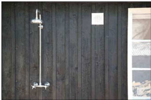
Det enkle koncept med få installationer er stadig gældende for havbadene. Der er ikke behov for spabad her.

Ved rådmandsbeslutning er i maj 2006 afsat 200.000 kr. til gennemførelse af nødvendige analyse- og projekteringsarbejder samt efterfølgende licitation vedrørende genopretningsarbejder på Den Permanente – og tilsvarende 50.000 kr. til Ballehage.