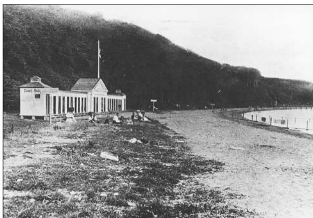
Badeanstalten Trouville fra 1910 var en umiddelbar forløber for Ballehage Søbad.

Syd for byen blev der også opført en række havbade. Først og fremmest den kommunale Søndre Badeanstalt ved Strandvejen ud for Marienlund. Den svarede til den Nordre Badeanstalt og blev på samme måde benyttet til skolesvømning. Der lå også et par andre, private badeanstalter ud for Strandvejen, bygget over samme koncept. Kort før Første Verdenskrig, blev der opført to badeanstalter på stranden ud for Dyrehaven, den nordligste del af Moesgaardskovene. Den store herregård var overtaget af Århus Kommune i 1898 og nu var der mulighed for at opfylde borgernes ønsker om at komme ud til skov og strand.