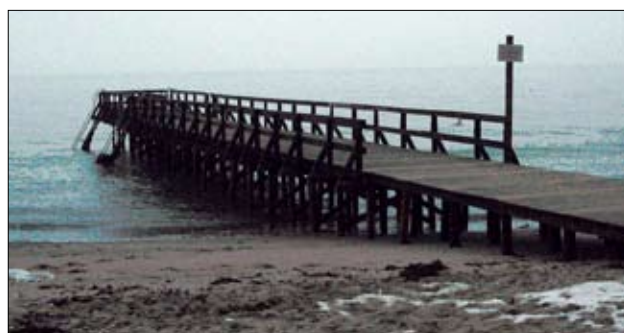
Den nuværende korte badebro med underdimensioneret stolpeværk